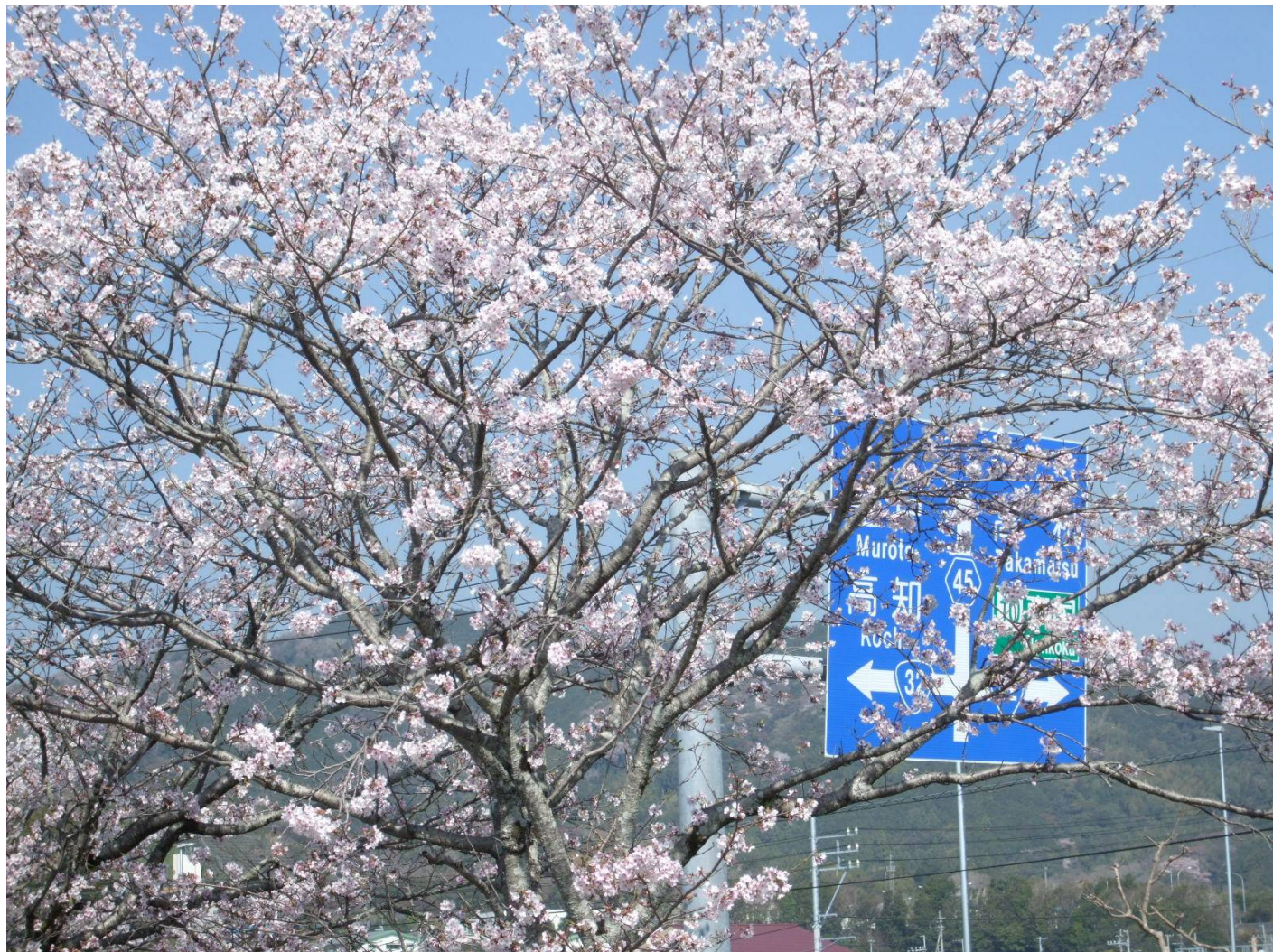
♪青空に映える風良里の桜。春爛漫です!!