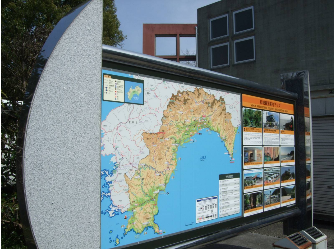
♪板面一新。高知の地理がひと目でわかるよ!!