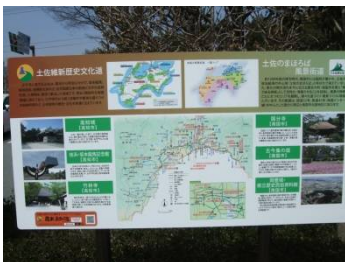
♪歴史の薫る土佐の道だよ。