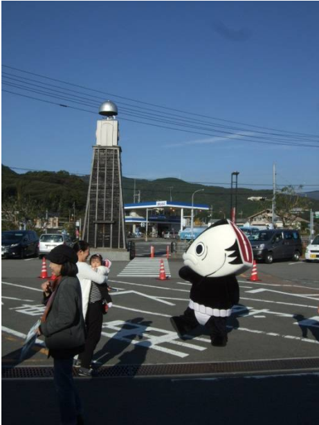
♪青空の下お客様と。