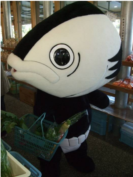
♪風の市でお買い物中。