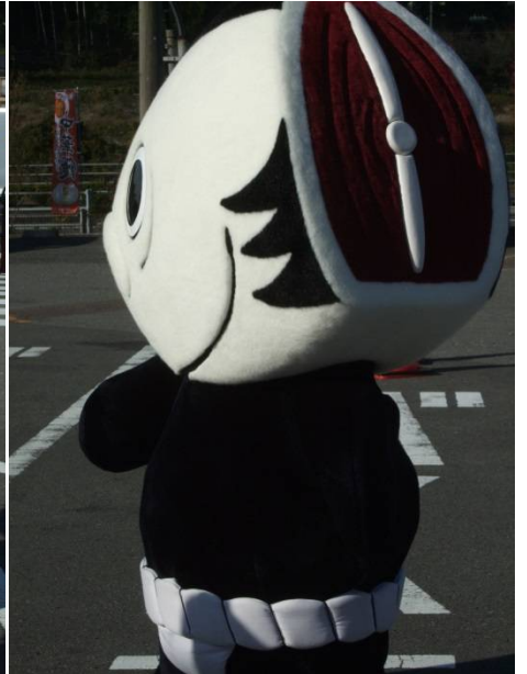
♪後ろから。後頭部の切り落としがよくわかる。