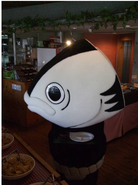
♪カフェレストでバイキングメニューを選ぶ。