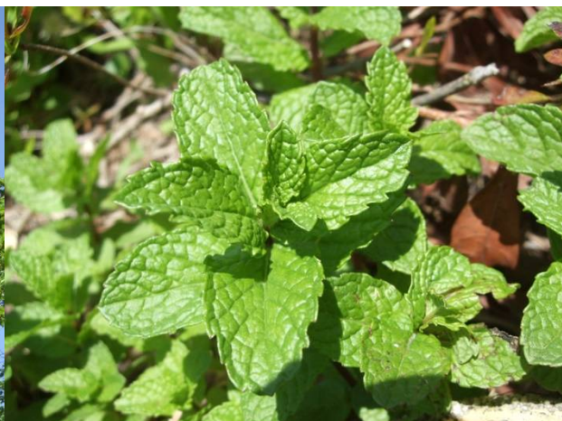
♪ ミント系ハーブ 探してみてネ。