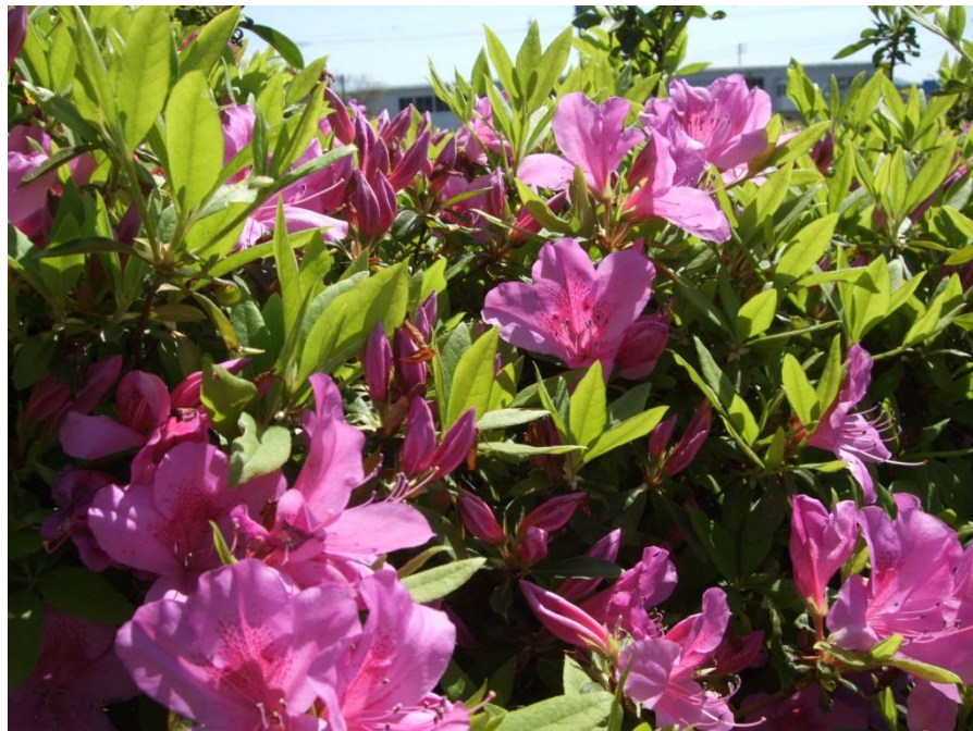
♪ 青空に映えるつつじの花!!