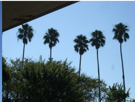
♪ やっぱり緑があると落ち着くね。

8月来まともに晴れる日がなく9月に入っても毎日雨、、、が、、ついに8日(月)、青空キター!!