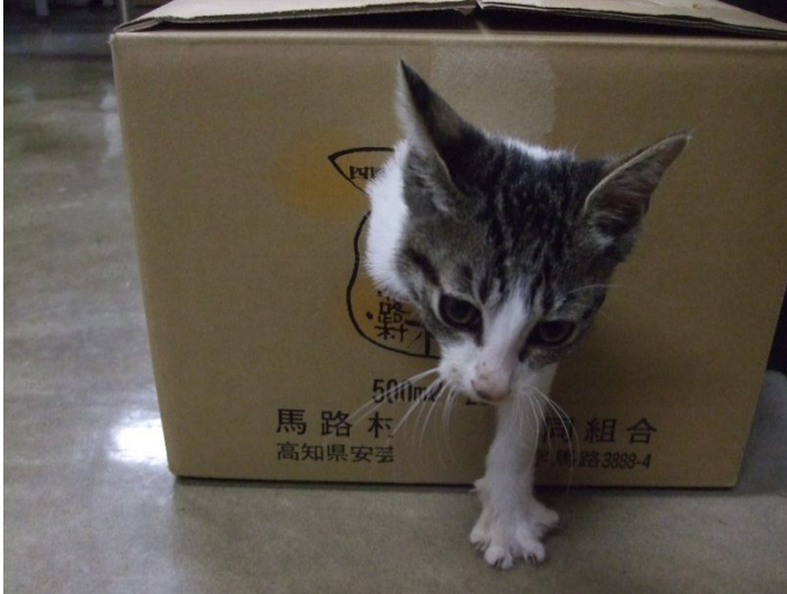
♪ 出現。手(前足)に力、入ってます。