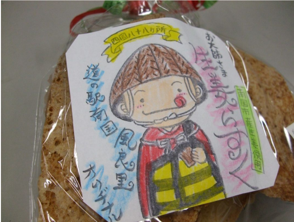
♪ かわいいイラスト原画も、スタッフの手描きだよ。

お土産のショップ風良里スタッフが発案して、市内『パン工房フォンテーヌ』さんに製作を依頼、味を練ってオリジナル商品化した『生姜ラスク』、南国市産の生姜を使っています。