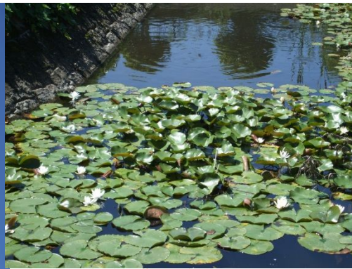
♪ 白い花が見えますか?

左画像、これ何よ?って思われるのもごもつとも。余りにも空が『夏』だったものだから、ご批判を承知で青空そのものを激写。