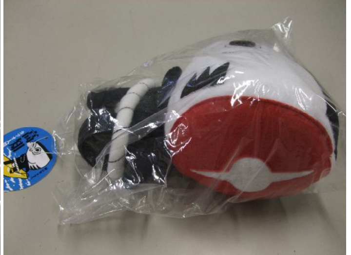
♪ 大変ビミョ〜な、話題の後頭部デスヨ。