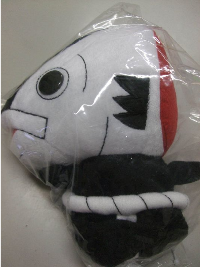
♪ 高知カツオ人間。振りふんどしもりりしいゾ!!