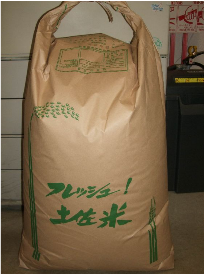
♪ すごい迫力。ずっしりと重いゾ!!