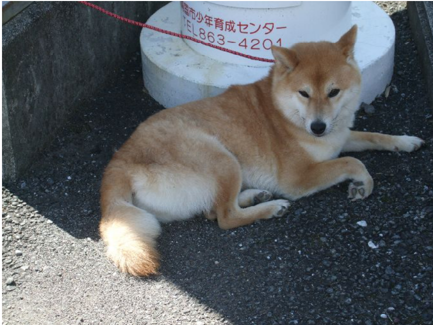
♪ あ、ついよ～、できれば脱ぎたいこの毛皮。