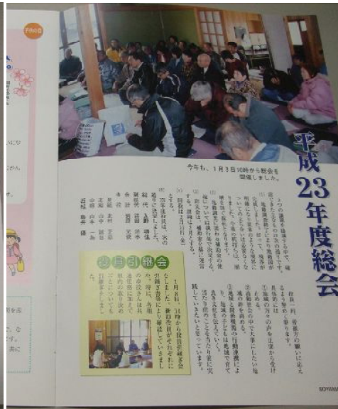
♪ 内容 地区総会のように。