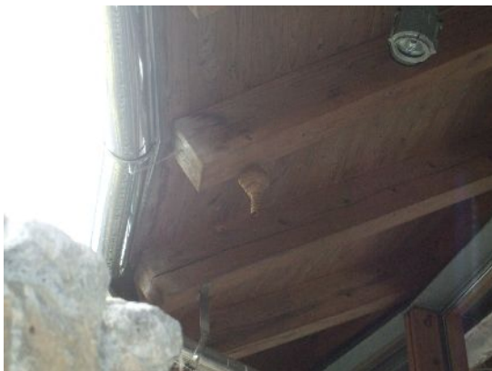
♪ とっくり型の物体デス。

画像中央、カフェレスト風良里の軒下にぶら下がるこの物体は?? 徳利を逆さまにしたような形なので、トックリバチの巣?と思いネットで検索してみると、確かに蜂の巣のようではあるが、トックリバチの巣はもう少し小さく形も違う(素朴な弥生式土器みたい)。