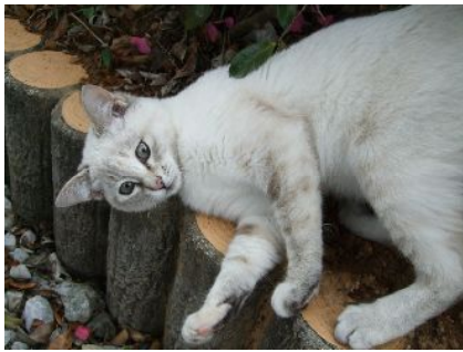
♪ 擬木の上でごろごろ。