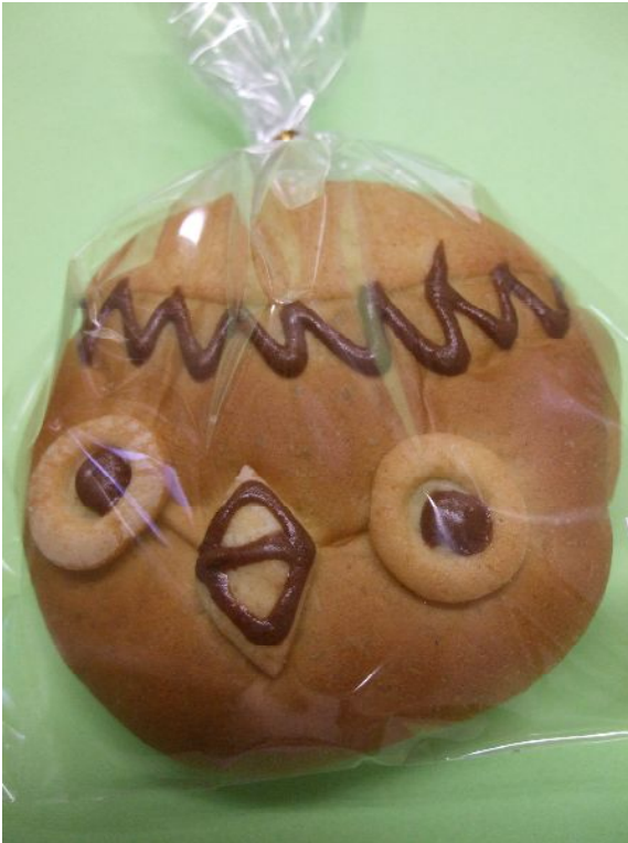
♪ 私がかっぱちゃんです!!

私、道の駅南国のお土産店『ショップ風良里』に住むかっぱちゃんです。河童(かっぱ)というのは全国的名称でして、ここ高知では猿猴(えんこう)などと呼ばれ、数々の伝説とともに親しまれています。