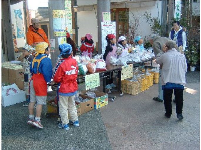
♪ これは 昨年 の販売の様様です。

来る 12月4日(金) 、毎年恒例の標記イベントが開催されます。これは、地元南国市立奈路(なる)小児童が北海道の支笏湖児童との交流等に役立てるために、父兄や地域住民の皆さんと一緒に手作りした木炭「なるっ子炭」やお芋を販売する行事です。今年ももうすぐ炭の釜出しがあり、それらをきれいな袋や箱に詰めて売ります。