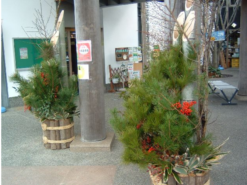
♪ 松竹立てて門ごとに祝う今日こそ楽しけれ～。

クリスマスもすぎると、今年も残りあとわずか。本日を入れて5日で、いよいよ最終カウントダウンに。