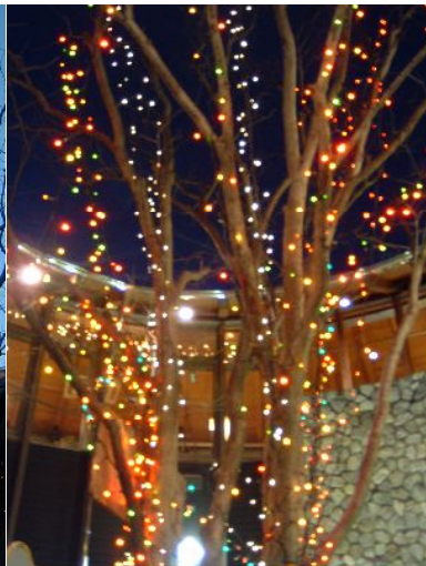
☆ 夜はこんなに絢爛豪華!!

風良里本館中庭の樗(けやき)に施しているイルミネーション、本来はクリスマスのイベントとして始めたものですが、ここ数年温暖化のせいかわ木の落葉が遅く今年はやっと23日に。折角つけたので、年明け後も、1月中は点灯予定です。