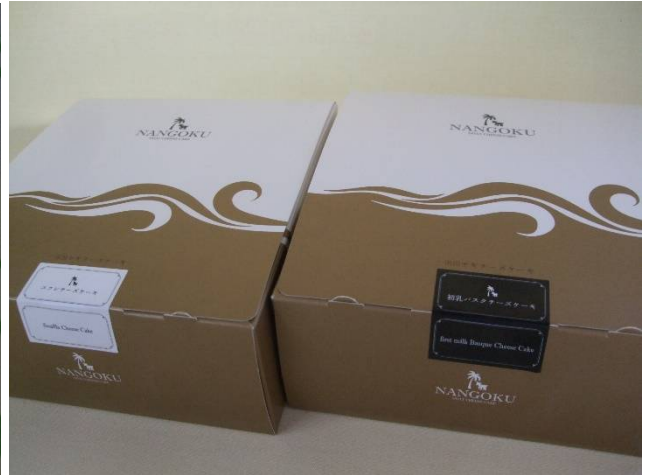
♪ ホールサイズ スフレ(左)とバスク(右) だよ

本紙先週号でお伝えしたショップ風良里の新商品『南国ヤギチーズケーキ』の詳細をお伝えします。