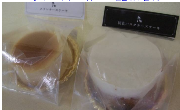
♪ ミニサイズ スフレ(左)とバスク(右) 直径 5 cm 位

市内川添ヤギ牧場のヤギミルクを使用しパティシエが一つずつ丁寧に手作りした逸品です。入荷すぐ購入して試食したら、