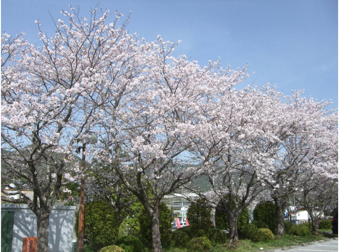
♪ 青空に映える満開の桜。