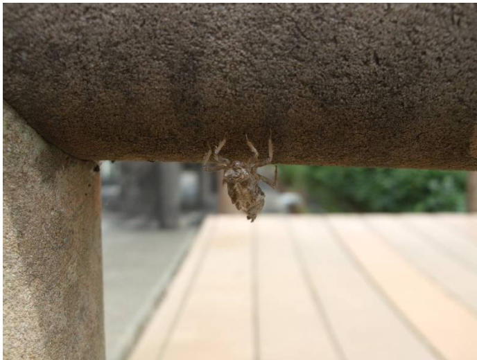
♪ここから羽化したよ!!