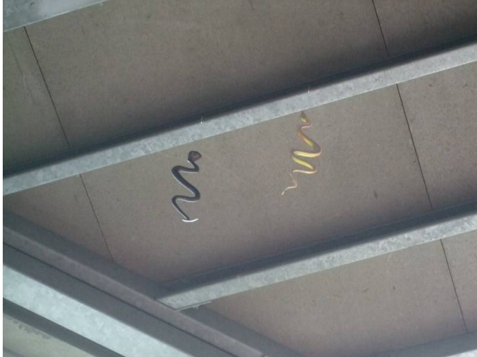
♪こんな高い所にいるよ!!