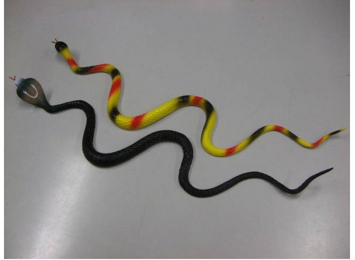
♪コブラのコーちゃんとヤマカガシ?のヤマちゃん。