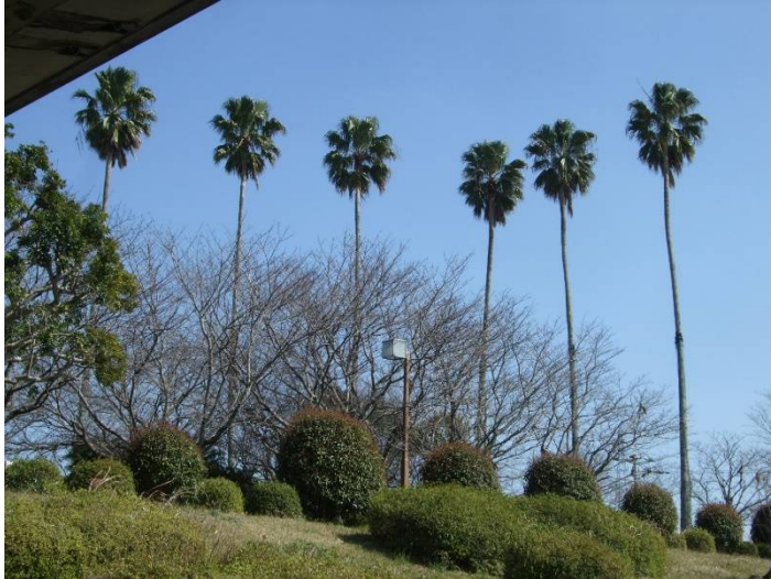
♪空はこんなに青いのに