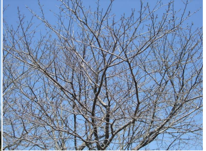
♪風良里の桜は枝ばかり