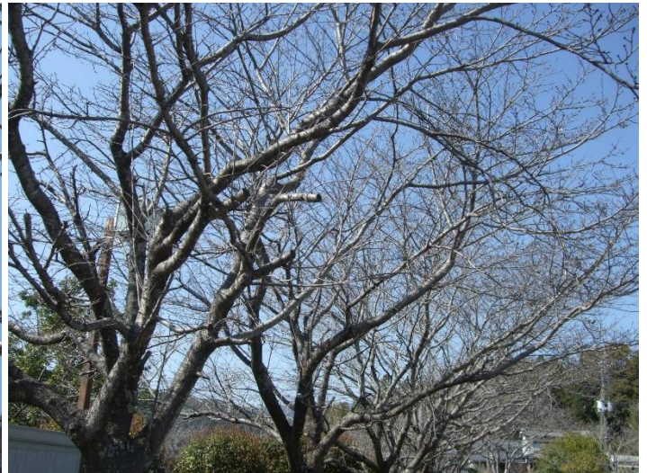
♪春の来るのはまだ遠い

日に日に暖かくなり、天気も悪くなく、、、けれどもここ道の駅南国風良里の桜は未だ咲かず。というより、3月24日(火)現在では、上記画像のとおりつぼみも膨らんでおらず、いつ咲くかは未定の状態。北の方、東京などはもう満開のようだが、こんなこと(南が後)もあるんですね。