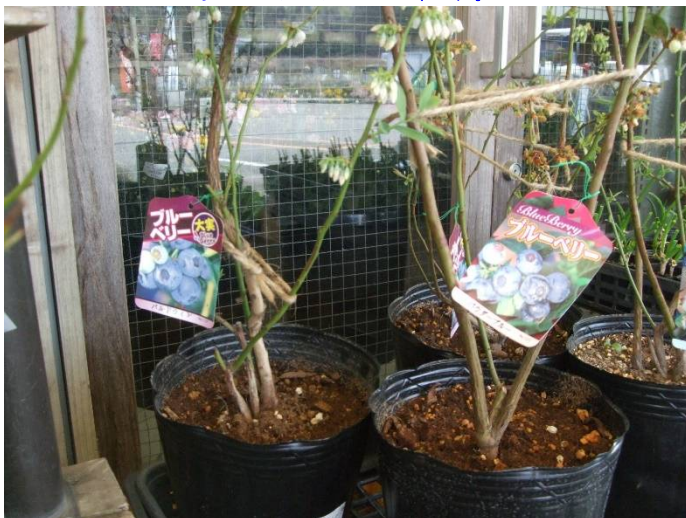
♪ 眼にもいい!! ブルーベリー。