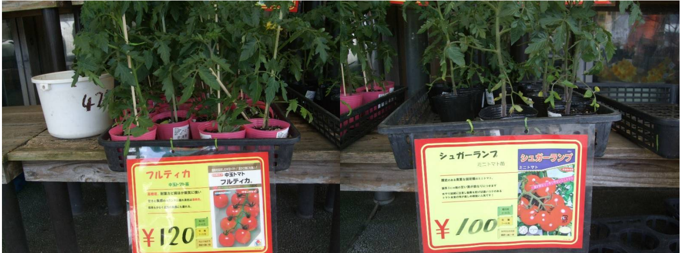
♪ ミニトマト フルティカ種。