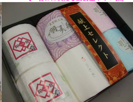
♪ 賞品は極上トイレトーパー!!

道の駅南国の屋外トイレが、この度高知県おもてなし県民会議より『おもてなしトイレ』優秀者として表彰されました。建物のハード面も先年大改修、今年度は通路の夜間照明も整備され使いやすく、清掃もシルバー人材センターの方が心を込めて毎日実施しています。