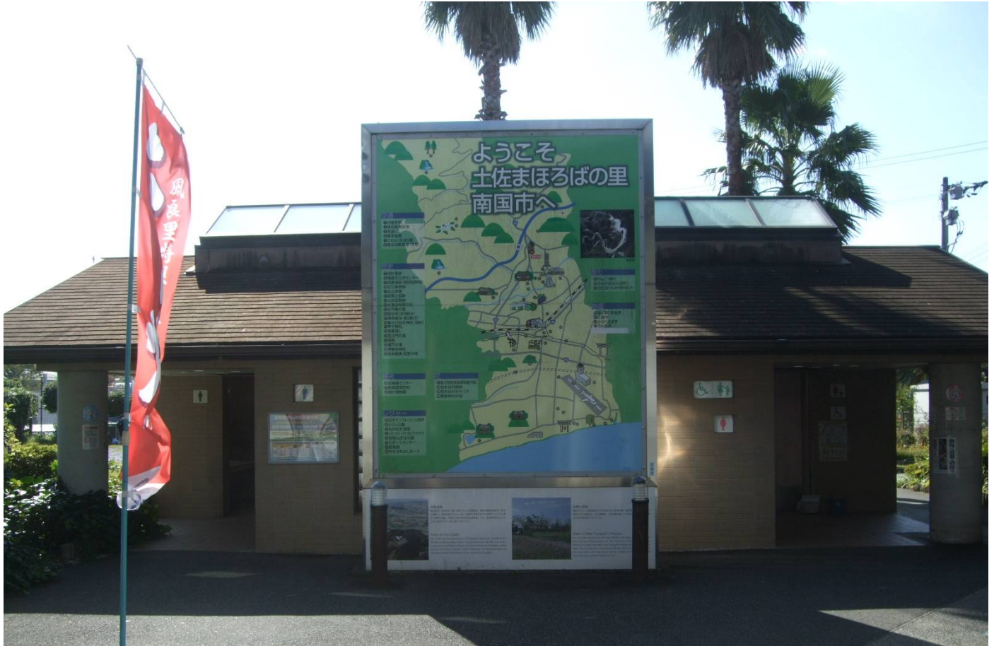
♪ 朝日に映える風良里トイレ棟。