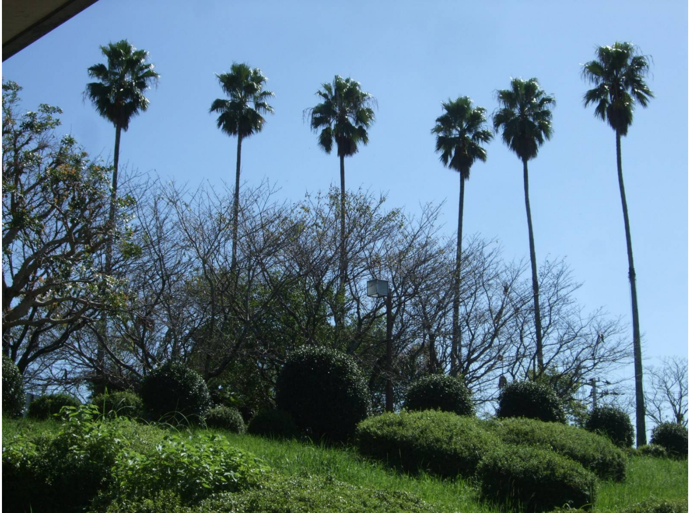
♪ 椰子の樹の上の空。