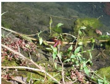
♪ 画像中央 赤とんぼ わかるかな？